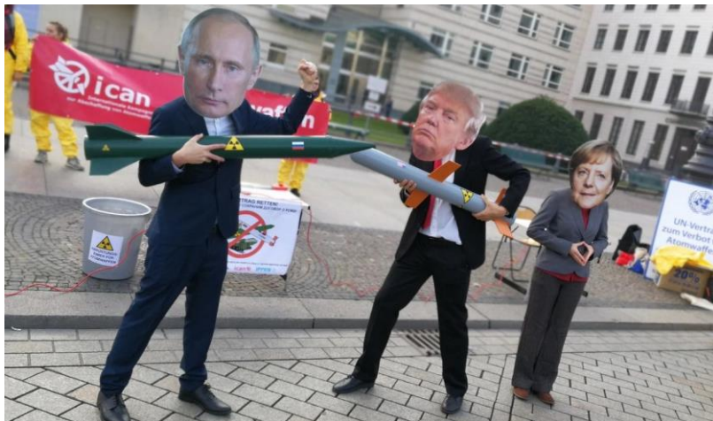
Putin und Trump drohen mit Atomwaffen. Kann Merkel die Unbeteiligten spielen?